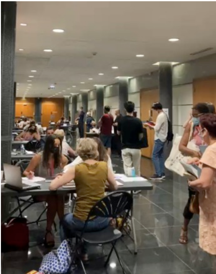
Rencontres Artistiques Edition 2021 Espace Landowski, Boulogne-Billancourt

Vraiment des belles rencontres. Je trouve que c'est une super initiative !