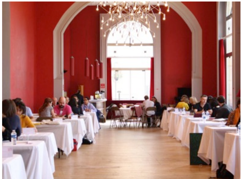
Rencontres Artistiques Edition 2019 Espace Palissy, Boulogne-Billancourt