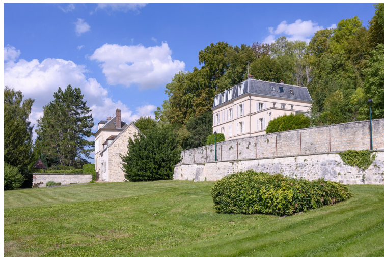
La Villa Dufraine

Extraits du texte Bonsoir Mémoire de Lou-Justin Tailhades, commissaire de l'exposition