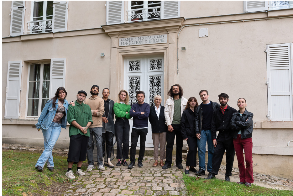
Les artistes en résidence autour de Jean-Michel Othoniel devant l'entrée de la Villa Dufraine